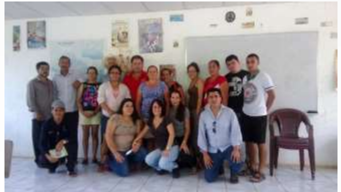
Pobladores de la comunidad de Santa Marta, Cabañas y equipo de investigación del CEES.