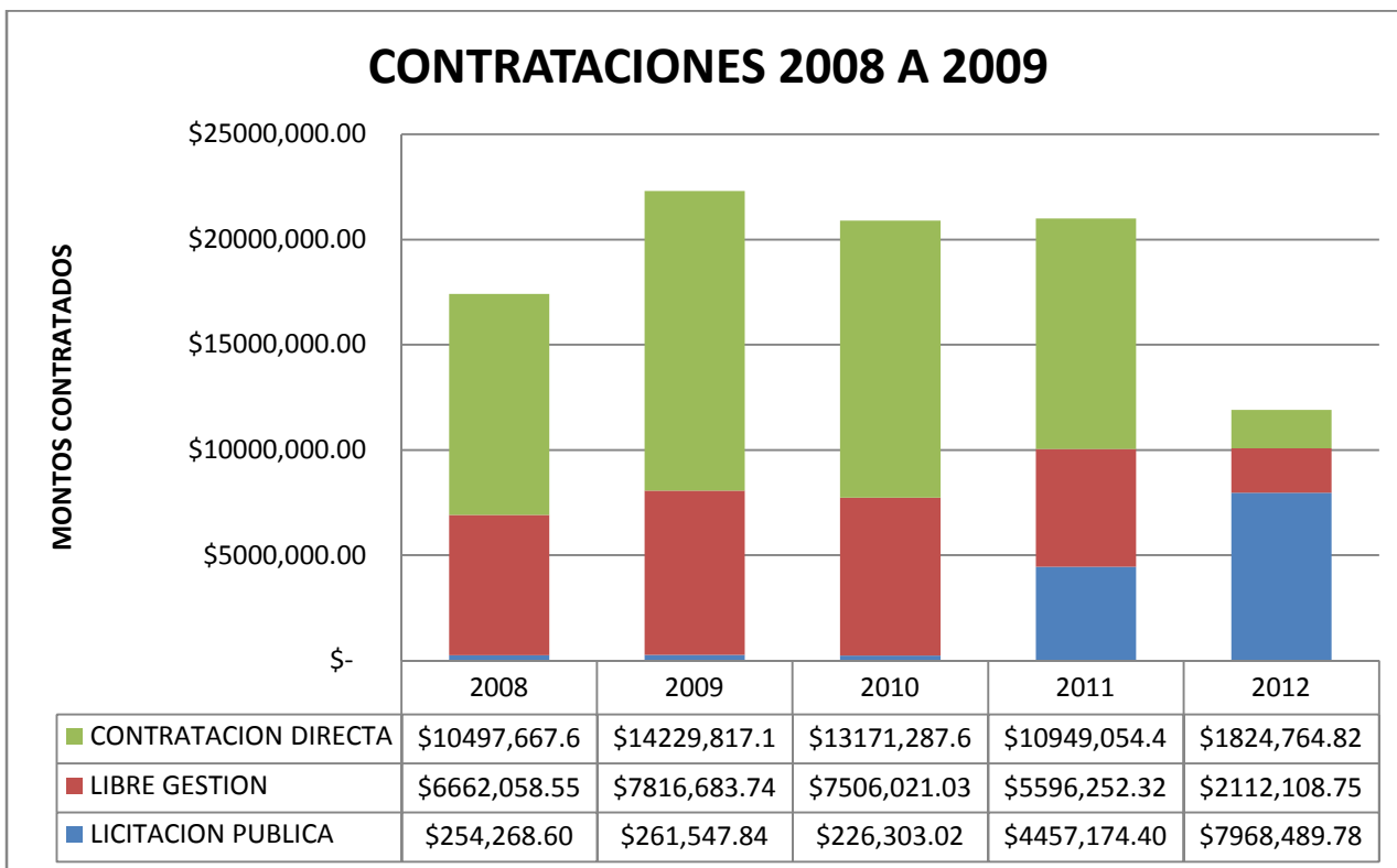
Grafico 1: Contrataciones directas desde 2008 al 2012

Fuente: elaborado en base a datos presentados por Transparencia Activa.