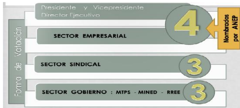
Imagen 1. Consejo Directivo

El Consejo Directivo se compone por un Presidente, Vicepresidente y 8 Directores, los dos primeros elegidos de entre los representantes del sector empleador y lo elige el Consejo Directivo de entre sus miembros. 2